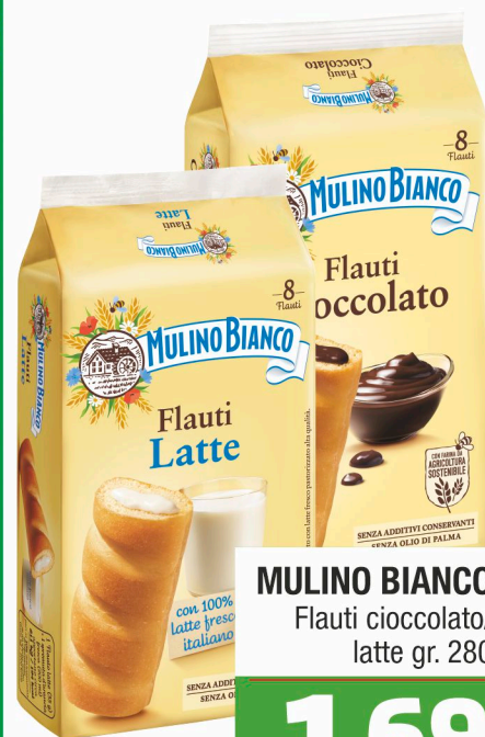
MULINO BIANCO Flauti cioccolato/ latte gr. 280