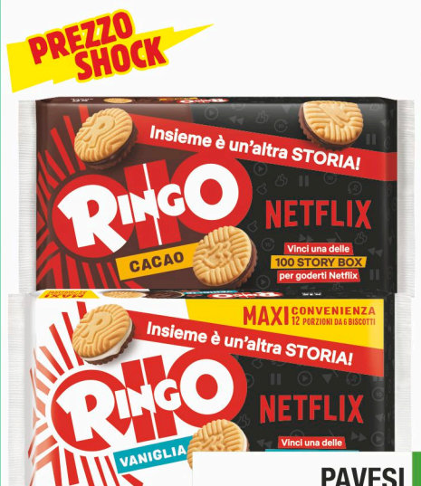
PAVESI Ringo famiglia cacao/ vaniglia gr. 330