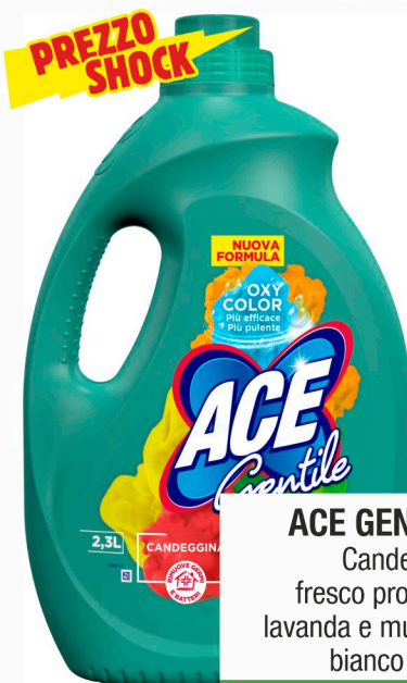
ACE GENTILE Candeggina fresco profumo/ lavanda e muschio bianco lt. 2,3