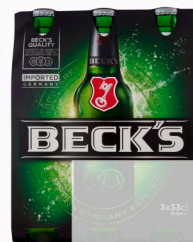
BECK'S Birra cl. 33 x3