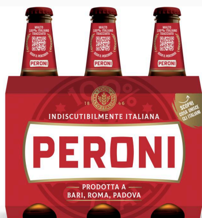
PERONI Birra cl. 33 x 3