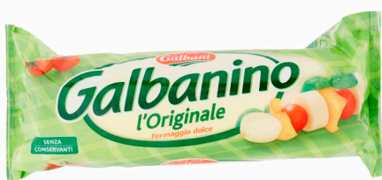
GALBANI Galbanino kg. 2 circa

OFFERTE VALIDE DAL 22 GENNAIO AL 4 FEBBRAIO 2025