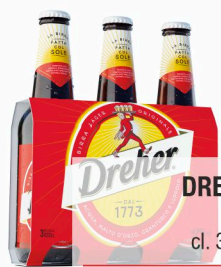
DREHER Birra cl. 33 X 3