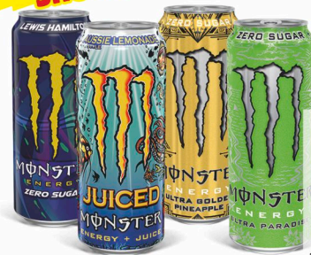
MONSTER Bevanda energetica vari gusti cl. 50