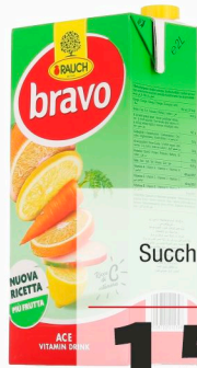
BRAVO Succhi vari gusti lt. 2